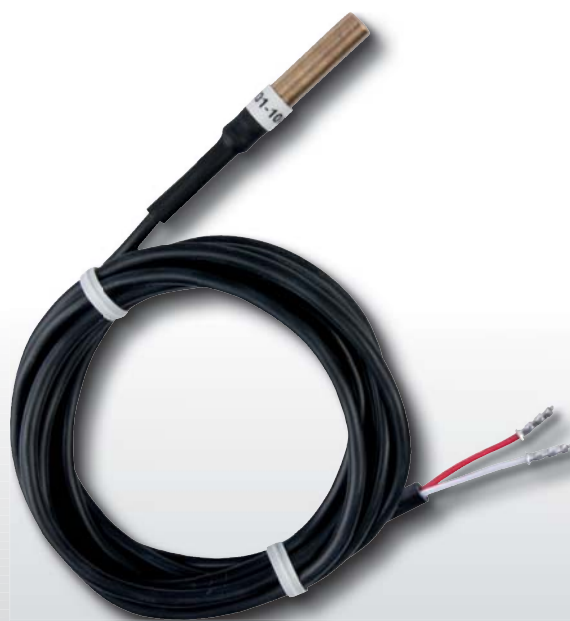
CT01 - 10K - Součást balení